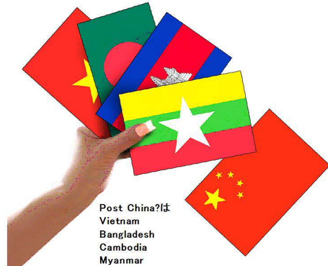
Post China?は Vietnam Bangladesh Cambodia Myanmar

長年海外生産に携わってきた知識と実績をベースに、最新中国縫製事情と、その進化した今後の方向性をレポートします。